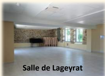
Salle de Lageyrat