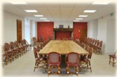
Espace Culturel des Deux Lions