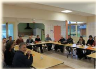
Salle des Associations