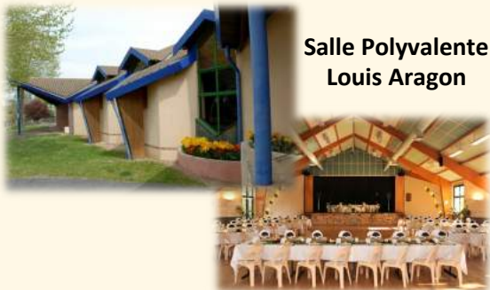
Salle Polyvalente Louis Aragon